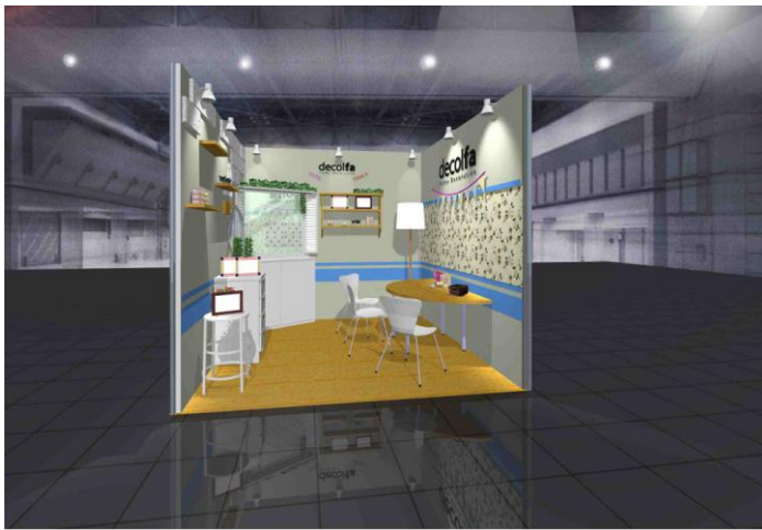
※「出展ブース」イメージ図