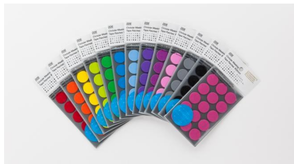
「STÁLOGY」マスキング丸シール

子供も大人もどちらも楽しめる内容となっておりますので、ぜひお気軽に参加してください。