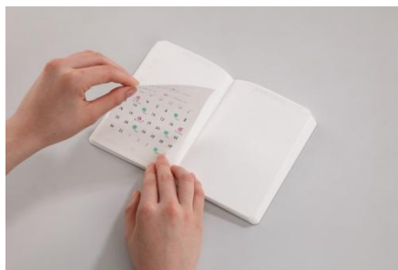
ぴたっと貼るだけ。貼ってはがして移動も可能