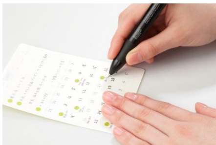
書き込み式の日付欄で、スケジュール開始日は自由設定