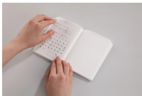
「貼ってはがせるカレンダーシール」と併用で、「365Days Notebook」の使い方の幅が広がります。