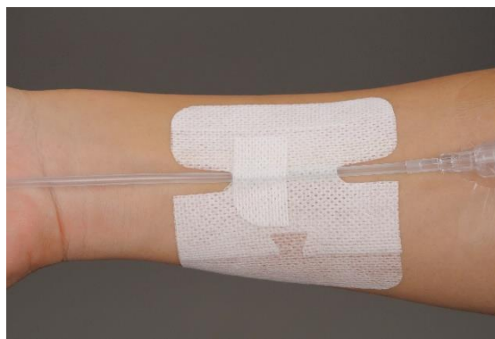
上下から両面テープで挟む『ミゼアセーフ W』使用イメージ

今回発売する2品はそれぞれ独自の形状を有しています。『ミゼアセーフ X』はクロスする形状で、固定力をアップして抜去リスクを軽減します。『ミゼアセーフ W』は2枚のシートがチューブを上下から挟み込む形状で、多種多様なチューブ類をしっかり固定できます。いずれもチューブ類の固定部位に使用することで、抜去抑止力を発揮します。さらに、通気性を高めた独自の粘着技術を用いた、かぶれにくい設計です。