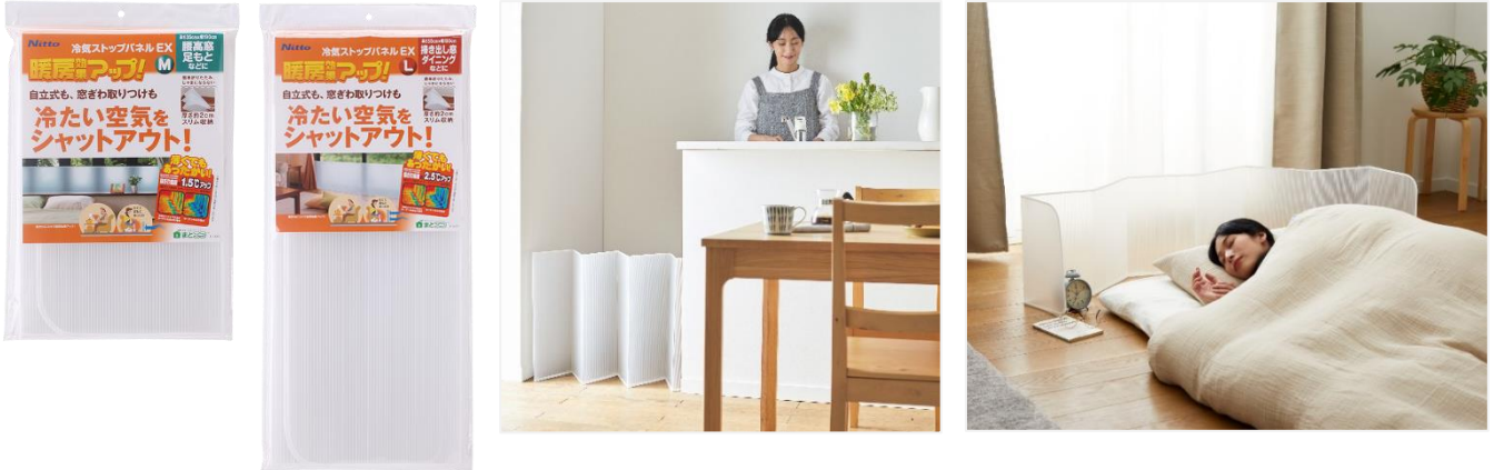
M サイズと L サイズの 2 種展開

ニトムズは、窓に貼るシートやサッシに貼るテープなど、大掛かりな工事を実施しなくても、手軽に部屋の断熱性を高め、暖房効率をアップさせる「まどエコ」シリーズを展開しています。快適な室内空間づくりや電気代の高騰による家計の負担削減に役立つと共に、ご家庭で簡単に実践できる省エネ活動にも活用いただけるシリーズです。