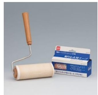
初代のコロコロ 『粘着カーペットクリーナー』

当初はカーペット専用の清掃用品でしたが、人々の住環境の変化に寄り添った開発を続け、フローリングや畳にも使える『フロアクリン』シリーズや、スマートフォンの画面の皮脂汚れを除去する『指紋コロコロミニ』など、用途に合わせてラインアップを拡充しています。ゴミがついた後でもめくり口がすぐわかり、気持ちよく切れる『スカットカット』機能や、テープ交換を