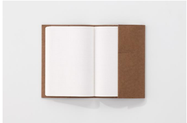
右ポケットは折り返すとブックマークになる