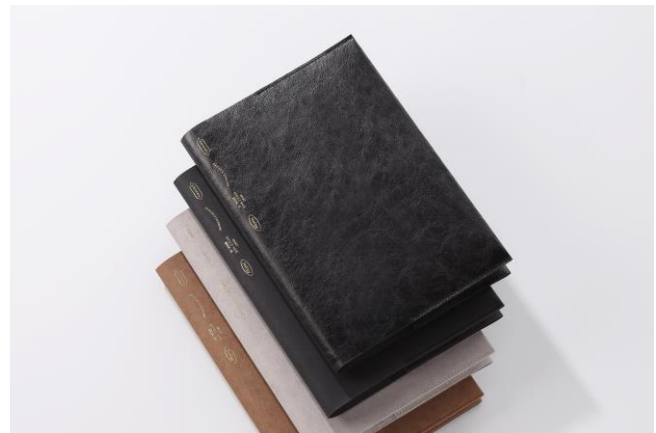
上からレザー紙 ブラック、ブラック、グレー、キャメル

※ STALOGY 東京ミッドタウン八重洲店（東京）、 日東堂（京都）、ニトムズ公式ショップ 楽天市場店