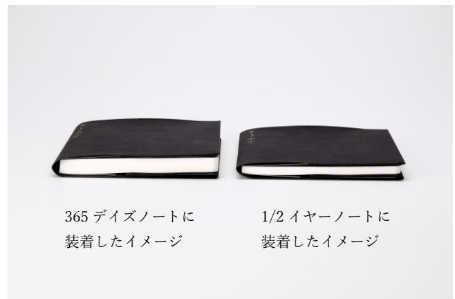
365 デイズノートに 装着したイメージ

『365 デイズノート』は1年間、『1/2 イヤーノート』は半年間使用できることをコンセプトにしており、丈夫でページ数が多く、長く使えるよう設計されています。毎日使用されることから、生活や仕事のパートナーのように大切に扱っていただくことも多いため、ノートを汚れや傷から守りつつ、ノートと一緒に使うふせんやシールなどのアイテムを筆記の邪魔にならないように収納できる、ありそうでなかったノートカバーを目指しました。必要最低限の機能と要素だけで構成した『365 デイズノート』『1/2 イヤーノート』の良さを最大限に活かすため、余分なものを排したミニマルなデザインに仕上げています。