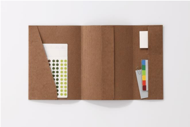
文房具を収納できる、大きさの異なる3つのポケット

『365 デイズノート』『1/2 イヤーノート』の筆記のしやすさを損なわないように、『ノートブックカバー A5 サイズ用』の左右についた計3つのポケットは、筆記時にページの下で凹凸しないように設計しています。斜めにカットされた見返しの左ポケットは、カバーを装着する際にはノートの差し込み口を兼ね、素材の重なりが最小限になるようにしています。カバーの折り返し部分を活用した右ポケットは、ノートの外側に開く仕様にして筆記の邪魔にならないように工夫を施しています。また、右ポケットはノートのページに折り返すとブックマークにもなる、無駄のないデザインです。