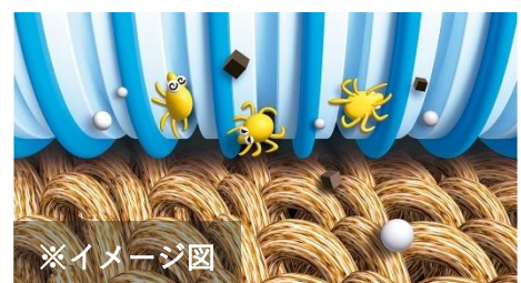
「立体粘着加工 ※1 」でダニをしっかり捕らえつつ、軽やかな使いごちも両立

従来の『コロコロ』でもダニを捕獲することはできましたが、時間が経つとダニが粘着面から自力で這い出てしまうことが試験により