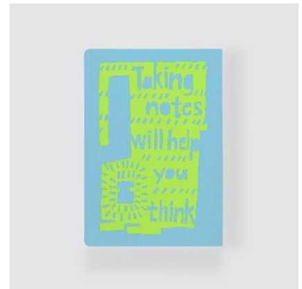
Taking notes will help you think. (メモを取ることは思考を助ける。)