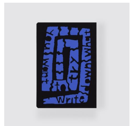
Write down what you want to try. (やってみたいことを書き出す。)