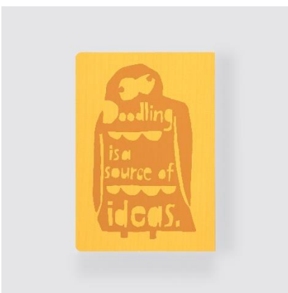
Doodling is a source of ideas. (落書きはアイデアのもと。)