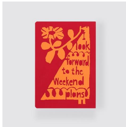
I look forward to the weekend plans. (週末の予定が楽しみ。)