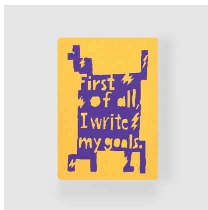
First of all, I write my goals. (まず、目標を書く。)