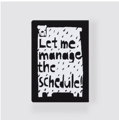
Let me manage the schedule! (スケジュール管理は任せて!)