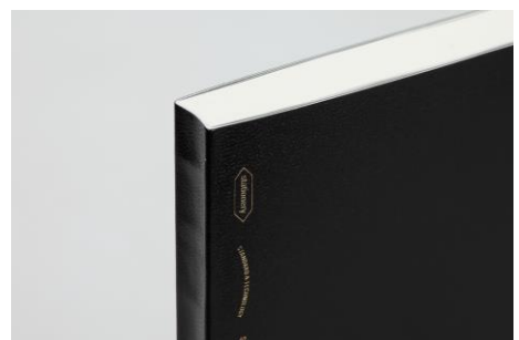
画像は 365 デイズノート (計 368 ページ)

ページ数は計 368 ページ (365 デイズノート)・計 192 ページ (1/2 イヤーノート) あるので、たっぷりと情報を書き込むことができます。また、極薄の本文紙を採用しているため、かさばらないコンパクトなサイズを実現しています。