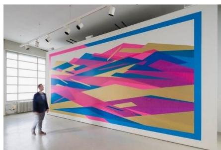
Travel Through design(ミラノ/イタリア) 2017