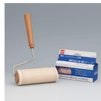
初代のコロコロ 『粘着カーペットクリーナー』

粘着クリーナー『コロコロ』は 1983 年に発売を開始し、2023 年に 40 周年を迎えたロングセラー製品です。倉庫で在庫整理をしていた社員が制服についたホコリを取るのに、粘着テープの粘着面が外側に出るように逆さに巻いて使用する動作を開発担当者が見てひらめいたのが『コロコロ』誕生のきっかけです。粘着テープは「モノとモノをくっつける」だけではなく「ゴミをとる」ことにも使用できることに気づき、試行錯誤を重ね、1983 年に『粘着カーペットクリーナー』を発売しました。それまで世の中に存在しなかったイノベティブな清掃用品だったため、社員による店頭での実演販売を通して認知とユーザーを増やしました。その後、次第にお客様から「コロコロするもの」と呼ばれるようになり、1985 年に製品名を『コロコロ』と改め、同年に商標出願をしました。