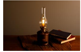
ランタンスピーカー