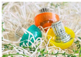
ミニチュアフィギュア