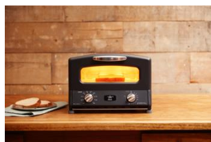
グラファイト グリル&トースター (ブラック)

※新商品は2022年11月14日(月)にアラジンダイレクトショップ限定で販売予定。