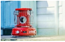
ポータブル ガス ストープ