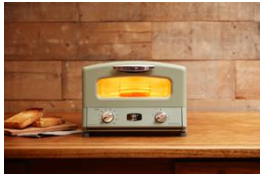
グラファイト グリル&トースター

「アラジン」では、ブルーフレームはじめ、調理家電、電気暖房、キッチン雑貨まで、すべての商品をご用意しております。今年10月に発売したばかりの新商品「グラファイト ミニグリラー」も販売いたします。「センゴクアラジン」は、ポータブルガスシリーズのフルラインナップを実際に体感いただけます。お近くに専門スタッフがいますので、商品の特徴や使用方法などご説明いたします。その場で購入いただくことができるため、購入を検討している方もこの機会にぜひお越し下さい。