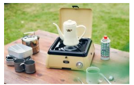
ポータブル ガス カセットコンロ kama-do