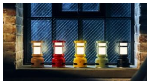
プチランタンスピーカー