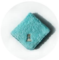
オリジナルタオルハンカチ (左：トースター 右：ブルーフレーム)