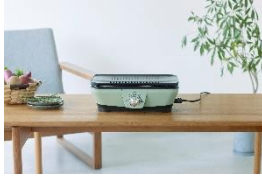
グラファイト ミニグリラー