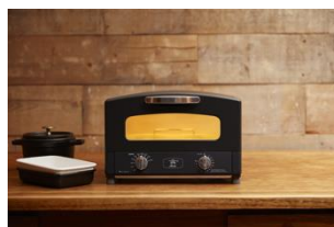
グラファイトトースター (ブラック)