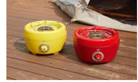
ポータブル ガス カセットコンロ ヒバリン