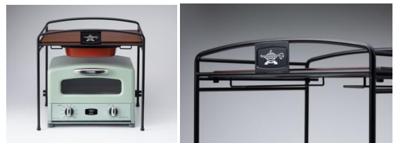
トースターラック