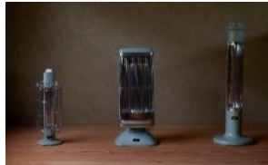
遠赤グラファイトヒーター