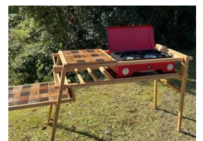
kama-do専用ラック (左：シングル 右：ツバーナー)