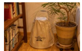
専用の収納袋付き