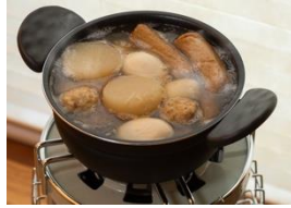
「煮る」おでんや煮物などに