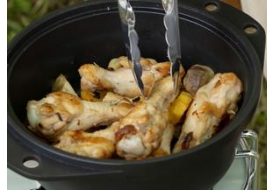
「焼く」チキンなどの焼き物に