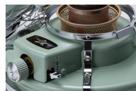
地震の際は自動で消火