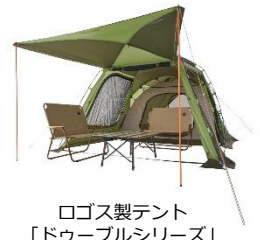
ロゴス製テント「ドゥーブルシリーズ」

※ロゴス製テント「ドゥーブルシリーズ(ROSYを除く)」以外のテント・シェルターでは使用しないでください。