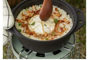
「炊く」炊き込みご飯などに