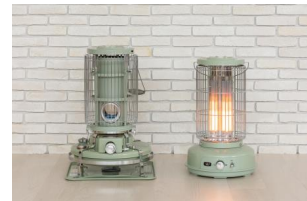
(左)ブルーフレームヒーター

90年以上にわたり愛され続ける「アラジン ブルーフレームヒーター」。その伝統的なデザインを受け継ぎつつ、現代の生活スタイルに合わせた電気ストーブへと進化させました。クラシックな美しさを保ちながら、最新技術を取り入れることで、どんなインテリアにも調和するエレガントなデザインに仕上げています。