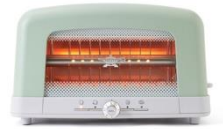
グラファイト ポップアップトースター AEP-G12A(G)