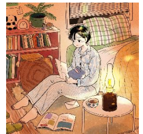
イラストイメージ

・アラジン公式Instagram： https://www.instagram.com/aladdin_jpn/