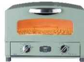
グラファイトトースター (2枚焼き) AET-GS13C(G)(W)(K) CAT-GS13C(HD)