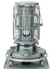
ブルーフレームヒーター BF3911(G)(W) BF3912(K)(G)