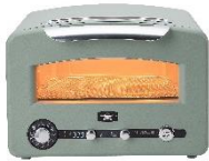
グラファイト グリル&トースター (フラッグシップモデル) AET-GP14B(G)(W)(K) AET-GP14A(G)(W)