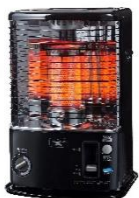
石油ストーブ AKP-U2802(K) / AKP-U2801(K) AKP-S2401(K) AKP-U2802Y(W) CAP-U2802(G)