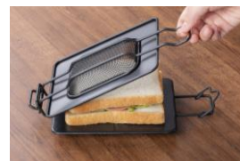
ホットサンドメーカー