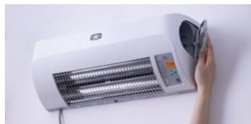
簡単にフィルターの取り外しができます。

温風・涼風の風を出す際、空気の流れは左右側面のフィルターを通してヒーターの反射板から風を流します。そのため、フィルターに埃がたまるように設計しております。目詰まりすると、暖房モードで本体内部の温度が上昇するためクリーニングお知らせランプが点灯し、お手入れのアナウンスをします。簡単にフィルターの取り外しができ、丸ごと水洗いができるので、お手入れ楽々です。