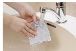
フィルターを丸ごと水洗いができてお手入れ楽々