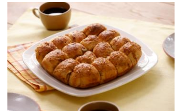
栗とオレンジの黒糖ちぎりパン