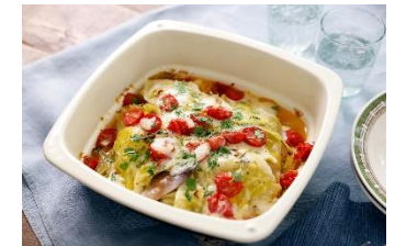
キャベツとひき肉のトマトチーズ焼き