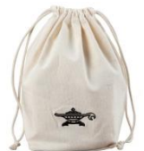
購入特典オリジナルグッズ