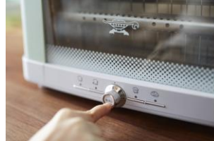
焼き色調節つまみ