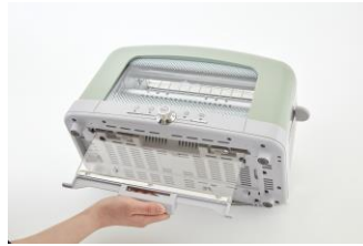
取り外せるのでお手入れも楽々