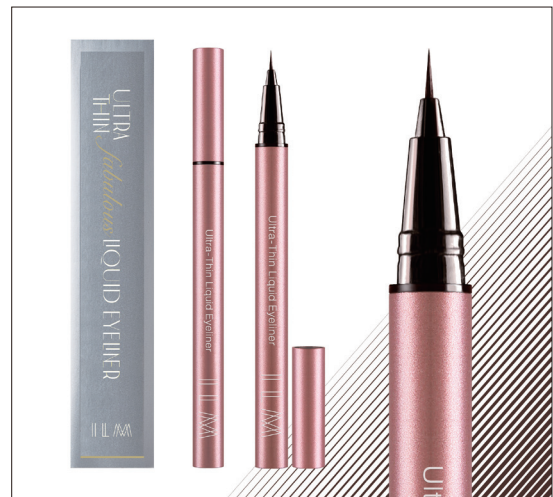
LE02 Mocha Brown