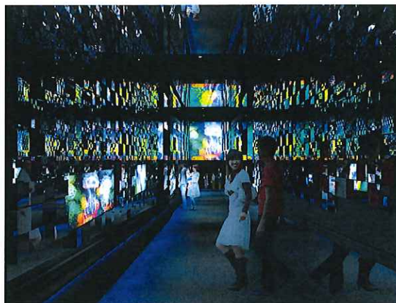
クラゲ万華鏡トンネル 夜バージョン（イメージ）