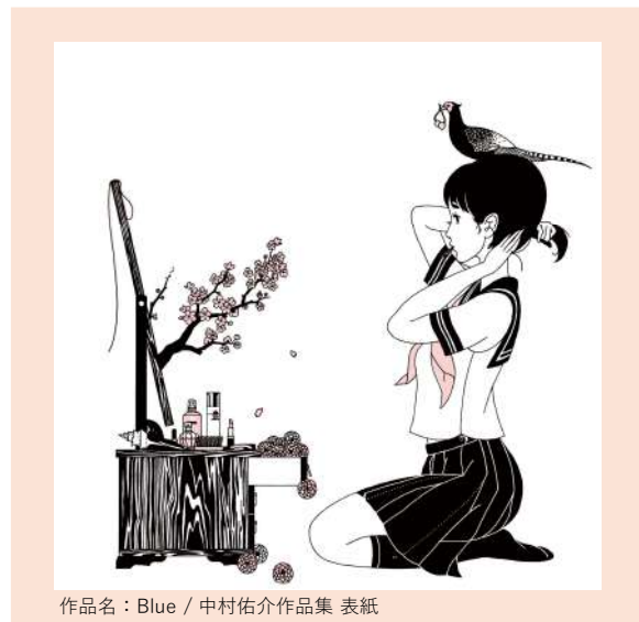
作品名：Blue / 中村佑介作品集 表紙