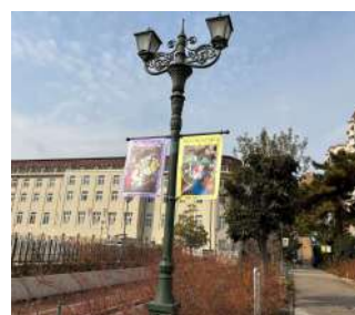
←花のみち フラッグ 掲出の様子

中村佑介の出身地である宝塚市ではこれまで、同氏が描いた宝塚観光ガイドブック(宝塚観光パンフレット)の表紙や、宝塚大劇場へ続く「花のみち」を飾るフラッグが街を彩ってきました。今回、満を持しての開催となる「中村佑介展 in TAKARAZUKA 2025」は、着色前の原画(線画)と完成画をあわせて展示する原画展です。原画は300点以上、完成画パネルなどは270点以上の他、映像展示や実物資料100点以上にもおよぶほぼ全ての作品を網羅し、中村佑介の軌跡を余すことなく辿ることができる内容です。