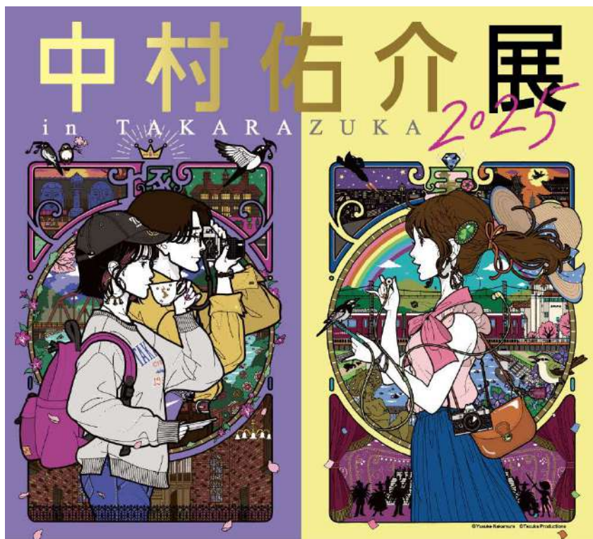
↑中村佑介展 in TAKARAZUKA 2025のキービジュアル

中村佑介は、ロックバンドASIAN KUNG-FU GENERATIONのCDジャケットをはじめ、『夜は短し歩けよ乙女』『謎解きはディナーのあとで』、音楽の教科書などの書籍カバーや、「大阪国際女子マラソン」のビジュアルを2022年、2023年、2024年と3年連続で手掛けるなど、幅広いジャンルで活躍するイラストレーターです。