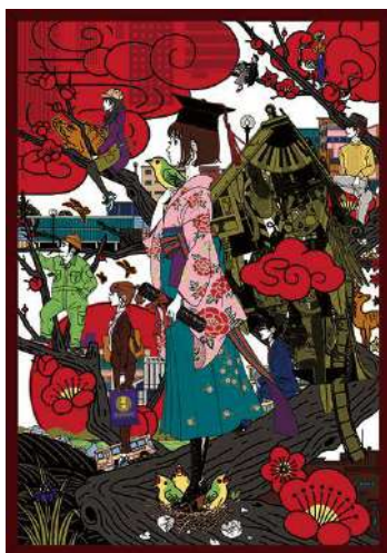
作品名：卒業 / 大阪芸術大学 描き下ろし