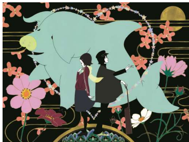
作品名：海豚 / (読み：いるか)