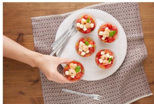
取り扱い商材 イメージ