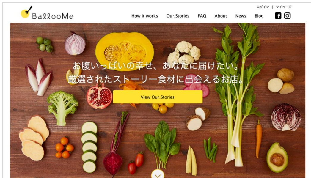
「BallooMe(バルレーミー)」トップページ