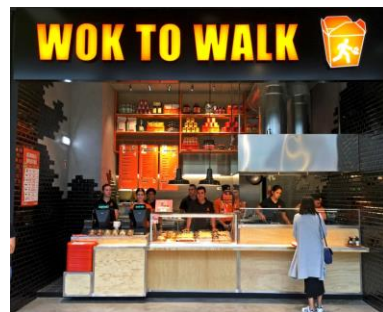
WOK TO WALK