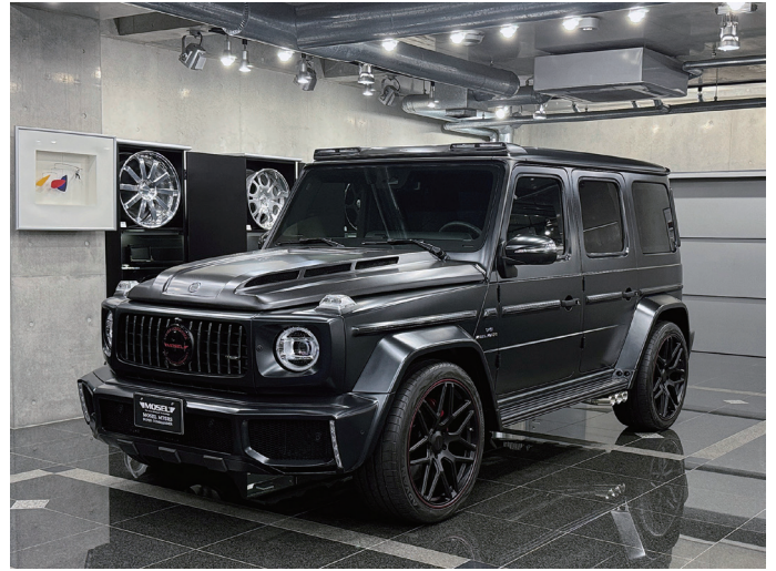
MOSEL M75RS SUPER COMMANDER CARBON PKG Based Car : G63 AMG