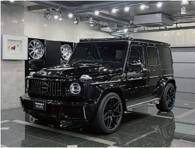
MOSEL M57RS SUPER COMMANDER Based Car : G450d