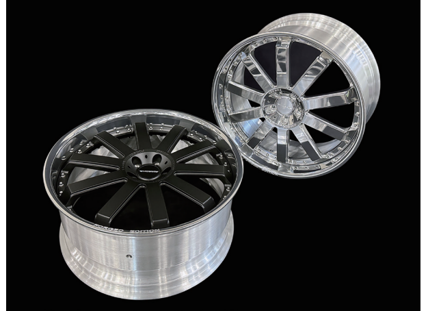
MOSEL MS10III FORGED 22inch 9,10J

「MOSEL MS10III」及び「MOSEL MST5III」は、既存シリーズを更に洗練させたSクラスW223用の22インチFORGED(鍛造)ホイールです。どちらもフロント用9J、リア用10Jをご用意。ディッシュのカラーリングは「MOSEL MS10III」ではポリッシュとマットブラックの2種、「MOSEL MST5III」ではポリッシュ、マットブラック、ブラック&ポリッシュの3種とオーナーの好みで選択することが可能です。また、W223の最新コンプリートカーを鋭意作成中です。今後も新しい世界を切り拓くMOSELの世界をぜひご体感ください。