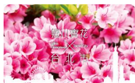
④ イージーカード (電子マネーカード)