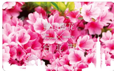
蜷川実花氏の作品を使用した限定版イージーカード

※イージーカード（悠遊カード）は台北の地下鉄（MRT）等で使える、電子マネーカードです。MRT では全区間運賃が2割引となる、台北旅行には欠かせないカードです。