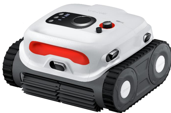
SUBLUE スマートコードレスプール清掃ロボット BN Pro

業務用清掃機器の専門商社、蔵王産業株式会社(本社：東京都江東区、代表取締役社長：沓澤孝則、以下当社)は、2025年5月より次世代スマートコードレスプール清掃ロボット“BN Pro”を販売開始します。