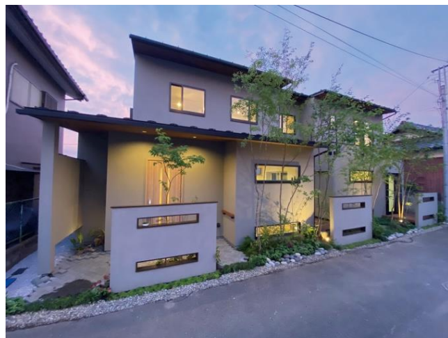
リノベ後：2棟を1棟の住宅にフルリノベーション