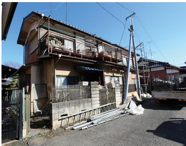
リノベ前：2棟並ぶ築50年の老朽化した家屋

断熱リノベによる既存住宅の高性能化によって、外の温度の影響を受けにくく、家の中の快適な温度を逃しにくくなるため、冬は暖かく夏は涼しく過ごせるように。このような開放的な空間デザインでも心地よくストレスフリーな家が実現できる。