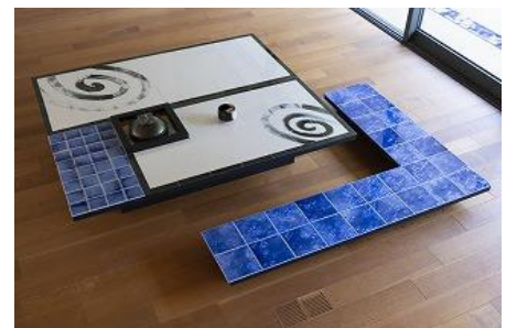
(写真4) 一畳台目 2022年 白磁

約2000×2200 mm