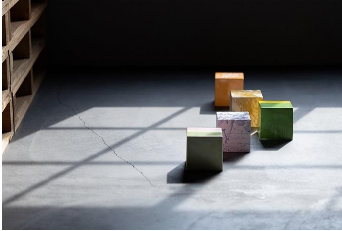
(写真1) CUBEの小さな旅 セラミック 100×100×100 mm / 2023

株式会社 LIXIL (以下 LIXIL) が運営する、土とやきものの魅力を伝える文化施設「INAX ライブミュージアム」(所在地：愛知県常滑市) は、2023年4月8日(土) から7月18日(火) まで、展覧会「石井春 時を旅する色・形・窯」を開催します。