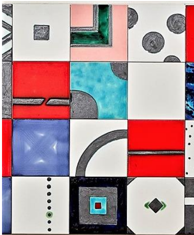
(写真2) 航海からの贈物(部分) 2019年 アズレージョ 800×5600×20 mm

出展作品の多くは、LIXIL やきものの工房が協力し、当館の施設内で制作されました。日本とポルトガルでは作品の素材となる土が異なるため、釉薬で色付けしても発色が異なります。彼女が求める釉薬の色や表情の再現には技術者が協力し、オリジナルの釉薬を使用して完成させました。それぞれの土の風合いや色合いに注目していただきながら、石井春のものづくりへの飽くなき情熱を感じていただければ幸いです。会場では、竹中大工道具館より提供いただいた石井氏のインタビュー映像を上映し、作品に込められた意図や工房での制作風景も紹介します。