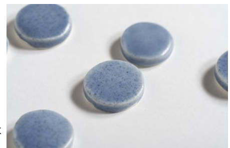
(写真5) しづく 2022年 セラミック(京都の土) 約φ20×5 mm / 撮影: photostudio K 写真提供: 竹中大工道具館

約2000×2200 mm / 撮影: photostudio K 写真提供: 竹中大工道具館