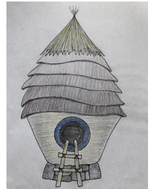
アセーナ・ステーン画

アメリカ南西部やメキシコ北部に点在する穀物倉は、トウモロコシや豆、種子など重要な食糧を収め守るため、繊維を土で接着してつくられました。メキシコ・チワワにある穀物倉を思わせるこの小さな土の器には、茅葺き屋根のように土の層が彫られています。私たちの希望や夢がいつか芽吹くそのときまで、この巣のような空間が安らぎの場になってくれるかもしれません。