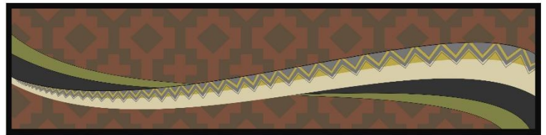
アセーナ・ステーン画 展示作品《Earth-Paint River-Wall》イメージ

プエブロの陶器や織物、建物のデザインによく見られる階段状の山のデザインは、プエブロのコミュニティを囲む聖なる山を表現しています。4点が東西南北に対応する菱形は地球を表し、すべての方向が収束する場所が中心となります。