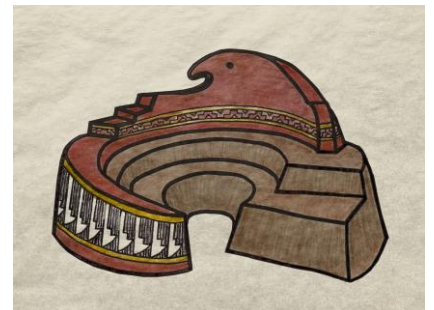
アセーナ・スティーン画

*注) 「キヴァ」: プエブロの心臓部に設置された、精神的・共同体的な儀式用の集会場。何層にも重なった山のような部屋に取り囲まれ、円形をしている。