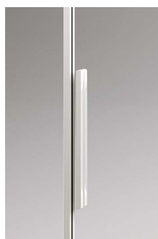
プレシャスホワイト