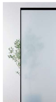
フロストホワイト