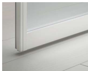
プレシャスホワイト