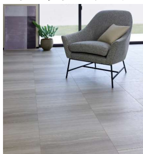
セルベジャンテ調 455 (幅広)