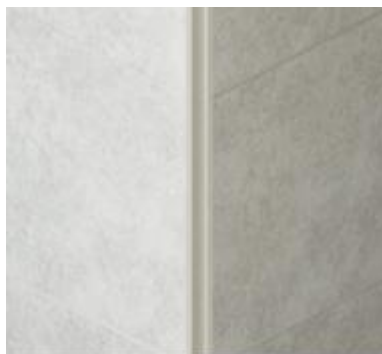
ガルバリウム鋼板製のコーナー部材（出隅部材）