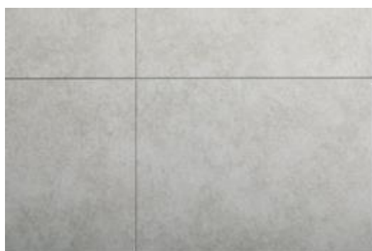
目地をすっきり見せるシーリングレス仕様