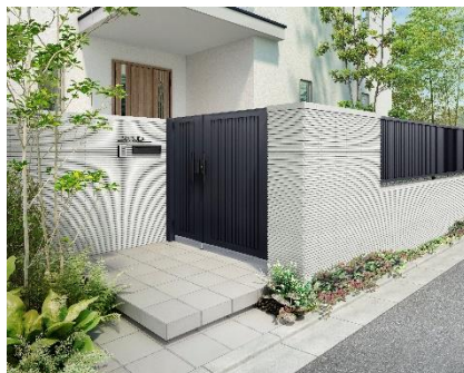
開き門扉 AB TS1 型 親子仕様 ダスクグレー