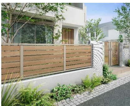
フェンス AB YS3 型 シャイングレー+オーク