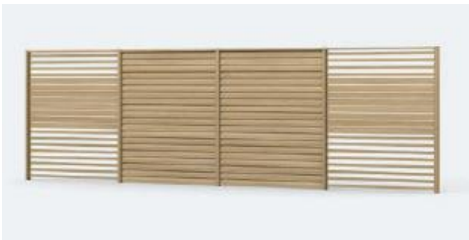
異なるデザインパネルを組み合わせも自由。各パネルの水平ラインが揃うので美しい外観

※スクリーン（枠）の高さ設定は 4 タイプ（H20、H23、H24、H29）から選べます。