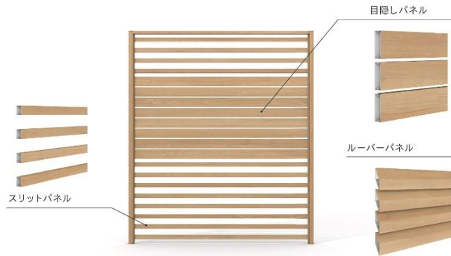
プライバシーの確保、通風性、採光性から