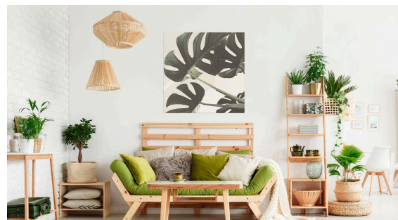
(左) [アール・ブリュット]57施工事例、(右) [アート&フォト]113施工事例