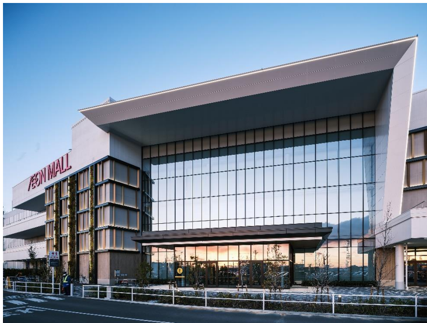
グランプリ受賞作品：イオンモール豊川(愛知県豊川市)

※LIXIL フロントコンテスト： https://www.lixil.co.jp/lineup/building_apartment_store/sf_contest/