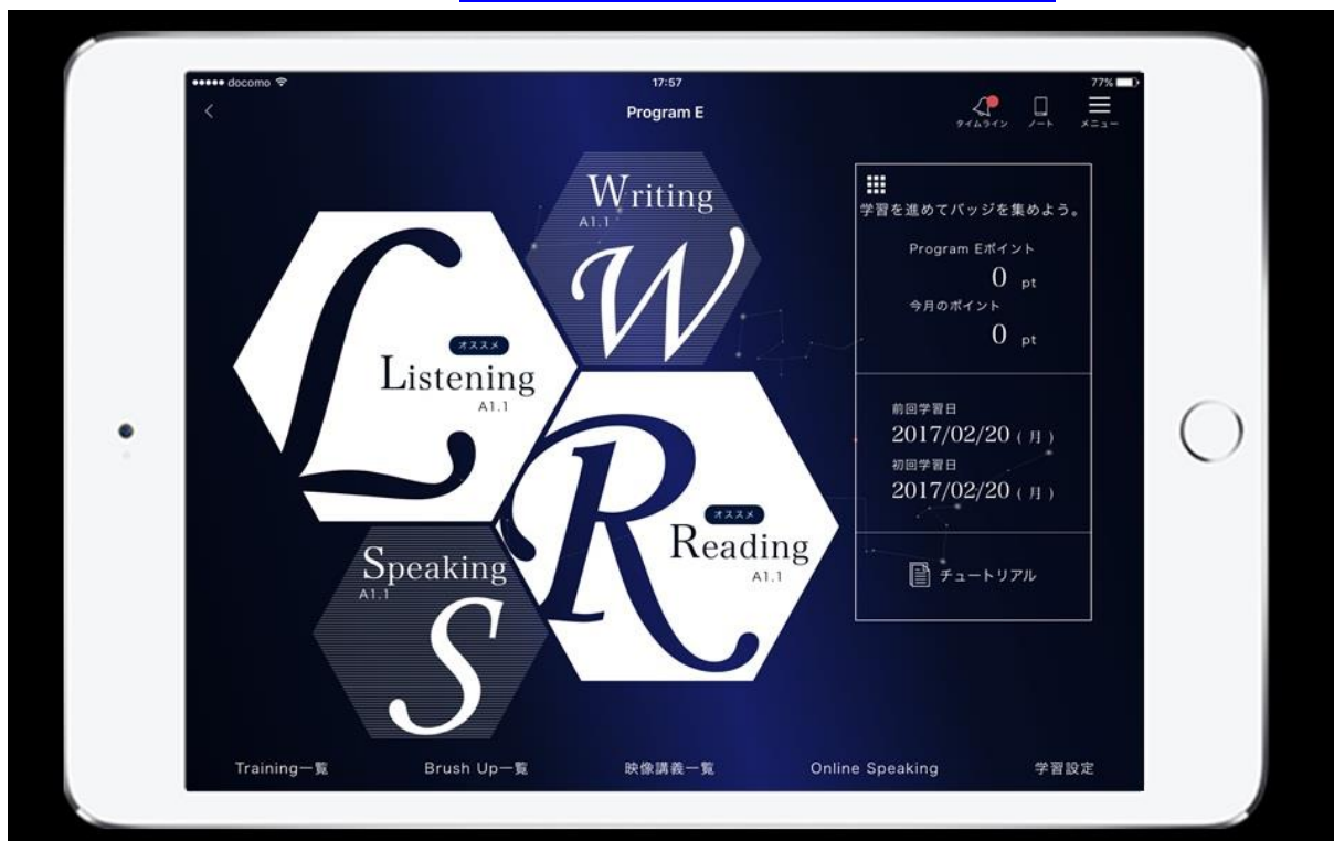
【Z会 Asteria 英語4技能講座 TOP 画面】

公式サイト http://www.zkai.co.jp/home/z-asteria/