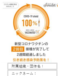
▲接種証明イメージ

（*1）公的な接種記録ではありません。また、接種証明のダウンロード機能は今後実装予定です。