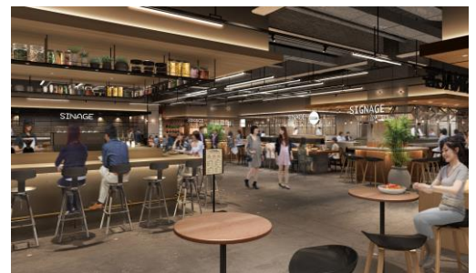
フードホール内観イメージ

出店フロア：3階「レストラン&フードホール」 面積：285.84 坪 店舗数：10店舗 開業日：2022年5月26日（木） URL： https://info.gnavi.co.jp/wye/