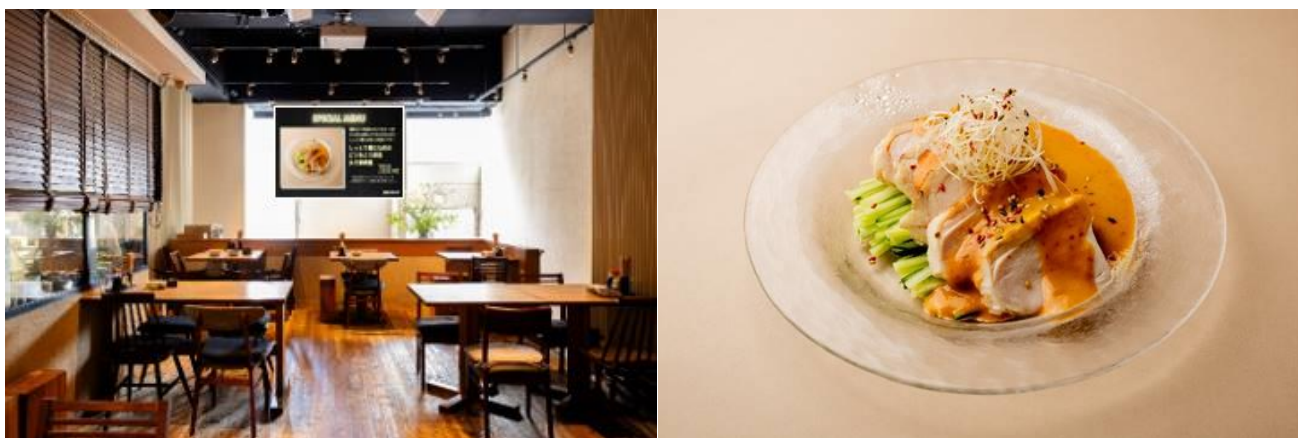
▲飲食店内の導入イメージ（左）メニューフェアで提供されるオリジナルメニューイメージ（右）

力を伝えるリアルな体験機会の減少が見受けられます。こうした企業・自治体がプロモーションを実施する上での課題を「ミセメディア」が解決します。