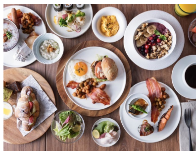
▲GINZA ONO Gratia Smoke Dining モーニングイメージ