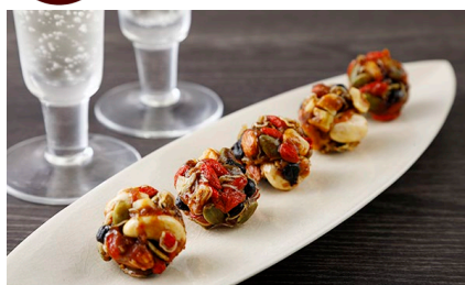
料亭のちりめんナッツ/ 下鴨茶寮 価格：1,620円（京都府）

ナッツに南瓜の種やちりめんなどが混ぜ込まれていて、お茶請けやお酒のお供として万能なので利用シーンは多いです。