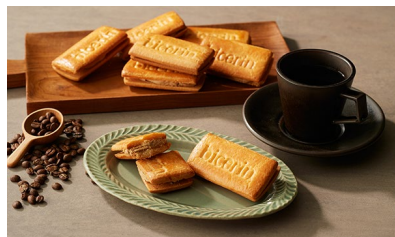
★ Bicerinコーヒースンド/ Bicerin NEWOMAN TAKANAWA 価格：4,320円（東京都）

個包装で日持ちがし、パッケージにも高級感があります。1つが大きくて食べ応えがある点も満足感があってよいですね。