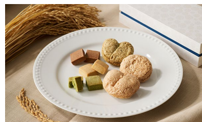
★米粉のお菓子 6種詰め合わせ/ C'est du nanan TOKYO 価格：3,024円（東京都）

日本の伝統的な縁起の良い柄で、鮮やかな色彩ながら優しさを感じます。個包装を開けた時に目を引く素敵で上品なデザインです。