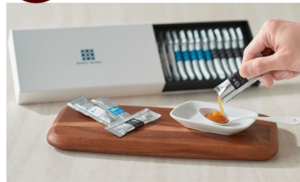
マヌカハニー スティックタイプ アソートギフト/ HONEY MARKS 価格：3,564円（福岡県）