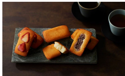
和乃果フィナンシェ10個入り/ 和乃果 価格：5,000円（山梨県）

紙袋とパッケージに高級感があります。箱の中に素敵なぶどうの絵があらわれており、細部までのこだわりが感じられます。