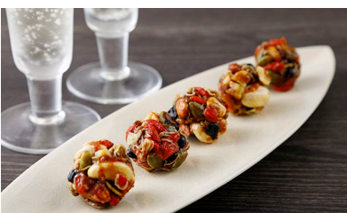
料亭のちりめんナッツ/ 下鴨茶寮 価格：1,620円（京都府）

店舗の設計デザインを担当された建築家の隈研吾氏が小豆と栗が好きで商品化されたというエピソードはお渡しする際の話題作りになります。