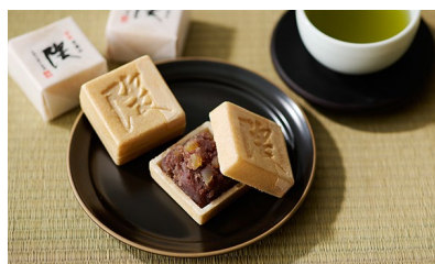
★謹製栗最中「隈」/ AOYAカンパーニュ 価格：3,240円（栃木県）

店舗の設計デザインを担当された建築家の隈研吾氏が小豆と栗が好きで商品化されたというエピソードはお渡しする際の話題作りになります。