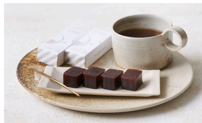
YOKAN FOR COFFEE 10pcs/ 都松庵 価格：4,536円（京都府）

“コーヒーのための羊羹”という提案型のギフトです。サイズもコンパクトで持ち運びやすく、日持ちもします。