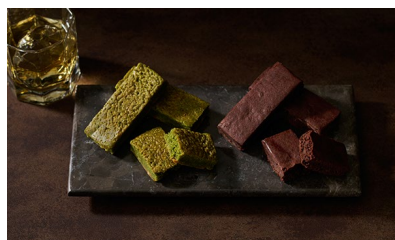
★銀座へしれブラウニー（プレーン&抹茶）/ Kuma3 価格：6,804円（東京都）

フレンチコースの一品が手土産で楽しめる点、フレンチで最中を使う意外性が渡す時のエピソードとしてつい話したくなるポイントです。