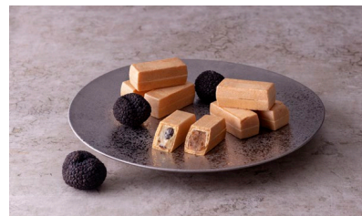
★トリュフ フォアグラ「しっとりポルデモなか」 Francais La Porte（フランスーズ ラポルデ） 価格：4,890円（神奈川県）

風呂敷数というのが「和」を感じます。チョコレートですが、和菓子っぽさもあり新しいです。干柿、胡桃、無花果の組合せが絶妙で良いと思いました。