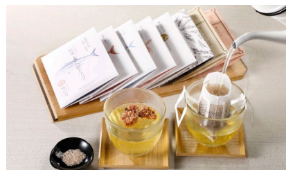
のむ天然おだし【雅】みやび/ 雅結寿 価格：3,384円（東京都）

手軽な方法で飲める淹れたての出汁は在宅勤務などおうち時間のお供として非常に喜ばれると思います。