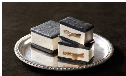
サブレ・オ・ブール/ Hugh Morgan 日本橋三越本店 価格：4,849円（東京都）

香り・味・食感に計算されたバランスが感じられる、特別なひとときにふさわしい逸品です。お茶やシャンパンとの相性も良く、ご挨拶時や来客時のティータイムに利用したいです。