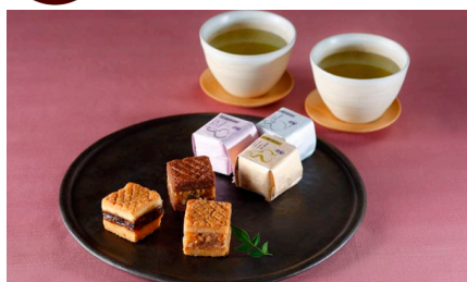
六瓢息災（むびょうそくさい） 3種セット・30個入り/ 廣尾瓢月堂 中目黒店 価格：6,868円（東京都）

「無病息災を願って」というメッセージを込められるので、今のご時世にも最適なお手土産として、何度もリピートしています。