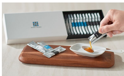
マヌカハニー スティックタイプ アソートギフト/ HONEY MARKS 価格：3,564円（福岡県）