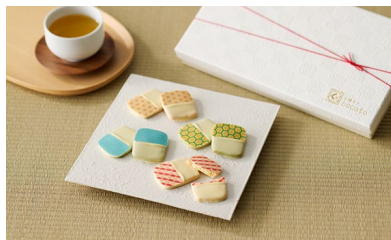
★京纏SHIROMUKU和柄クッキー(24枚入)/ 京纏菓子cacoto 価格：5,400円（京都府）

フランスのバターやチョコレート、日本の宇治抹茶や五島列島の塩など、国境を越えて選び抜かれた逸材が使われています。