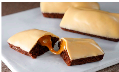
フィナンシェブロードキャラメル 10個入/ パティスリー&カフェ デリーモ 東京ミッドタウン日比谷店 価格：4,266円（東京都）