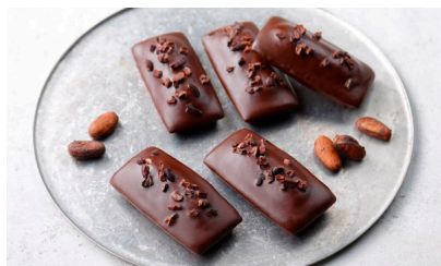
フィナンシェ ショコラ/ MAGIE DU CHOCOLAT 価格：4,750円（東京都）