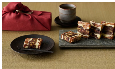
★干柿と胡桃と無花果のミルフィーユ/ 京. 洋菓子司 一善や 価格：4,212円（京都府）

個包装で日持ちがし、パッケージにも高級感があります。1つが大きくて食べ応えがある点も満足感があってよいですね。