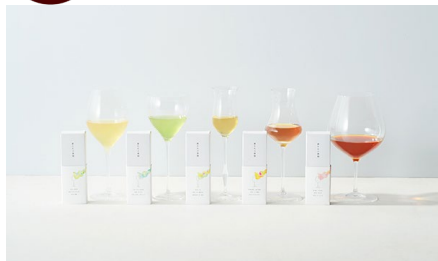
最高級 煎茶・釜炒り茶・和紅茶 ティーバッグ「香りたつ茶畑」/ Sora Japanity 価格：4,980円（東京都）

お茶をワイングラスで飲むという説明のパンフレットが素敵で、お洒落な方にも喜んでいただけそうです。