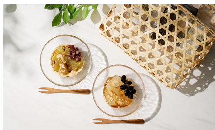
丹波わらび餅「縁(えにし)」/ ラ・クロシェット ヒラノ 価格：4,946円（京都府）