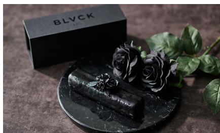
ラムレーズンチーズテリーヌ CHEESE TERRINE/ BLVCK PARIS 価格：2,238円（兵庫県）