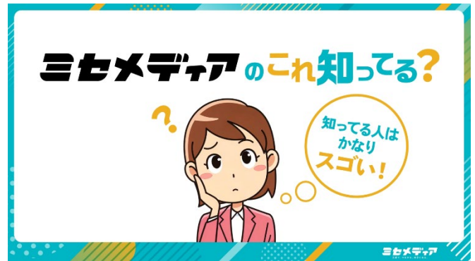
ミセメディアを知って、楽しむ映像演出を展開