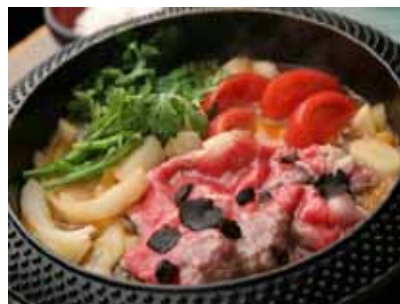
「和牛とトリュフのすき焼き」