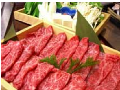
「米沢牛のしゃぶしゃぶ鍋」

贅沢感たっぷりの鍋として、「和牛とトリュフのすき焼き」やつけダレにフォアグラとトリュフを使った「A5牛すき焼き」まで登場。