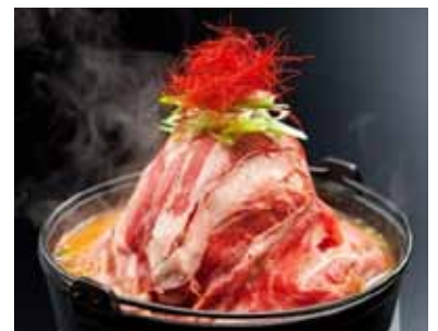
「ほぼ肉だけ鍋」(仮称)