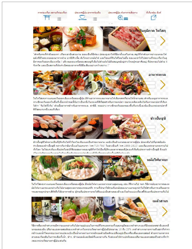
▲食文化情報ページ