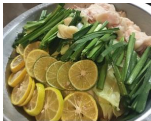
鉄板焼居酒屋ゆう谷町 「もつすだち」鍋」

https://r.gnavi.co.jp/b452303/ 埼玉県熊谷市筑波2-66-5