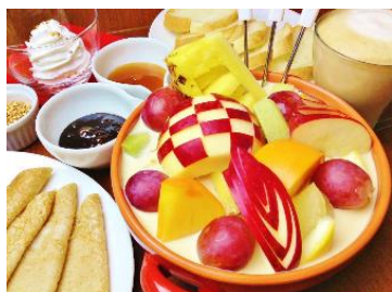
蕎麦カフェ&バルBW CAFÉ 「ホットフルーツ鍋」

ミルクやワインをベースにするなど様々で、スイーツのような新感覚の甘いお鍋。ティータイムの女子会やシメのデザートとしてお楽しみいただけるお鍋をご紹介します。インスタ映えの要素も欠かせません。