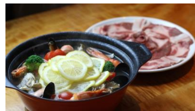
地中海食堂タイム 「イベリコ豚と魚介のレモン鍋」

https://r.gnavi.co.jp/fc4ux8wc0000/ 大阪府大阪市中央区谷町7-3-4 新谷町第3ビル1F