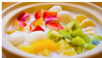
Part du monde 「ココナッツミルクのホットフルーツ鍋」

https://r.gnavi.co.jp/kysfj8e50000/ 福岡県福岡市中央区舞鶴1-8-39