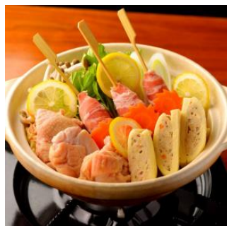
銀座ライオン 一番町店 「鶏肉と豚もち串の塩レモン鍋」

https://r.gnavi.co.jp/fbp1w2tk0000/ 兵庫県西宮市馬場町5-26