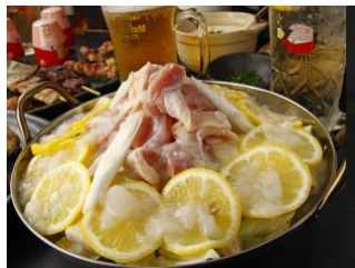
えいすけ 「烏レモン鍋」

アンケート結果で、食べたいフルーツ鍋人気No1のレモン鍋。ここ数年の瀬戸内レモン人気もあってか、国内産のレモンは出荷増で推移しています。（2016年農林水産省公表統計資料）さっぱりとした香りを楽しめるレモン鍋をご紹介します。