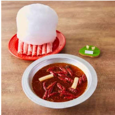
めり乃 秋葉原本店「【しびれ鍋】ラムしゃぶ食べ放題+Soft飲み放題付コース」

「しびれ鍋グランプリ」は全国の飲食店を対象とし、2018年11月15日（木）までエントリー受付中です。開催期間中に全国で提供される様々な“しびれ鍋”から、消費者の一般投票と“しびれ”に精通した審査員による審査により、全国でNo.1の“しびれ鍋”を決定します。スパイスにこだわった鍋からインスタ映えするインパクト大の鍋まで、各店舗から熱い意気込みと共にエントリーされています。現在、「しびれ鍋グランプリ」にエントリー中の“しびれ鍋”の一部をご紹介します。