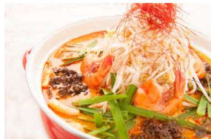
T W BRUNCH Cafe& Bar「ココナツミルクと豆乳のしびれ鍋」