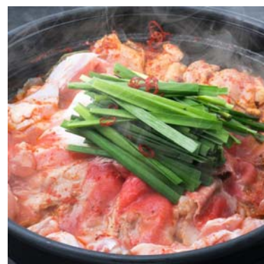
くいの屋わん 川崎西口店 「ヒリ辛！山椒肉鍋」

株式会社ぐるなび（本社：東京都千代田区、代表取締役社長：久保征一郎）は、2018年9月に今年の「トレンド鍋®（※）」として“しびれ鍋”を選定しました。また、全国でNo.1の“しびれ鍋”を決定する「しびれ鍋グランプリ」を開催し、今年の鍋商戦を盛り上げています。実際に ぐるなびに登録する飲食店でも約500店舗がしびれ鍋をメニューに導入し（2018年11月7日現在） 、これから迎える忘年会シーズンに向けて受入れ準備も万端となっています。