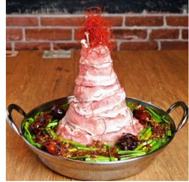
肉バルキングコング 鎌倉大船店「特製肉タワーしびれ鍋」