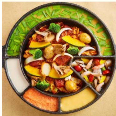
全席個室ダイニング忍家浦和駅西口店「しびれ鍋！麻辣ジンギスカン」