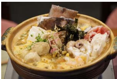
麺酒場 かもがわ「海鮮 酸辣(サンラー)ちゃんぽん鍋」