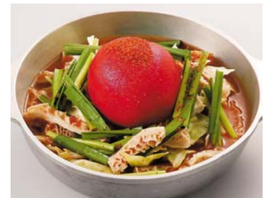
鳥彩々 北千住西口店「丸ごとトマトと牛トリッパの辛シビ鍋」