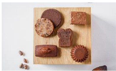
★ GATEAUX DE VOYAGE 焼き菓子/ ル・ショコラ・アラン・デュカス 東京工房 価格：3,240円（東京都）

☆名が表す通り、フルーツの存在感 が際立っている。パッケージも高級 感があり素敵。