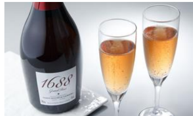
★1688 Grand Rosé/ 株式会社 YELL 価格：4,212円（東京都）

☆百貨店などでは売られていないので、希少性がある。驚くほど香りも良く、ギフトをもらい慣れている方にも喜ばれる。