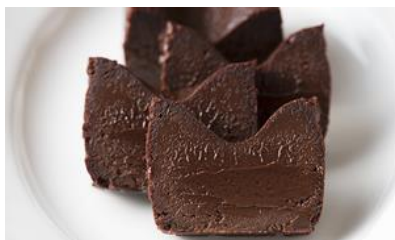
特撰ガトーショコラ/ ケズカフェ東京 価格：3,000円（東京都）

☆口当たりが滑らかで、とろける 食感。甘すぎず、男女問わずファン が多くいる一品。