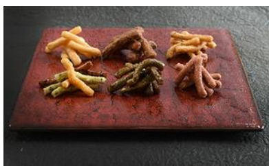
★日本橋錦豊琳のかりんとう 6個セット/ 日本橋錦豊琳 日本橋小伝馬町本店

☆金色のパッケージは高級感がある上に、おめでたい雰囲気もあるので、ビジネスの手土産にはぴったり。