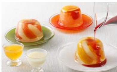
フルーツゼリー寄せ/ 京都吉兆 価格：5,400円（京都府）

☆口当たりが滑らかで、とろける 食感。甘すぎず、男女問わずファン が多くいる一品。