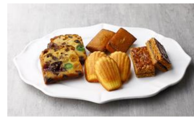
★ キャトルアソートC/ ルコント広尾本店 価格：2,710円（東京都）