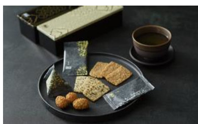
★赤坂あわせ（2缶入り）/ 赤坂柿山 赤坂総本店

☆一つひとつの包装が美しく、目を引く。日本の伝統的なお菓子として海外ゲストにお渡ししても喜んでいただける。