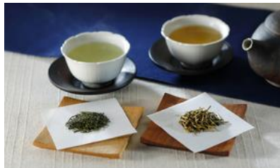
名人憲太郎詰合せ/ 神宮司庁御用達銘茶 芳翠園 松屋銀座店 価格：5,400円（東京都）

☆有名ホテルに提供しているという実績もあり、信頼できるお品。水出し可能なので季節問わず、自信を持ってお贈りできる。