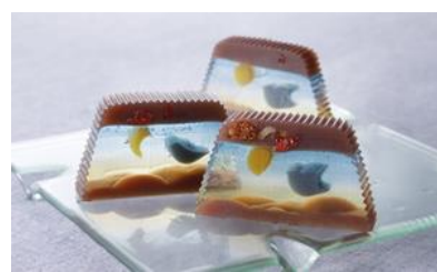
Fly Me to The Moon 羊羹ファンタジア/ 長門屋本店

☆おかきという昔馴染みで万人受けするお菓子でありながら、おしゃれさがあり、真新しい。