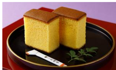
極上金かすてら（P）2S10個入/ 横浜文明堂

☆実店舗は富山県内にしかなく、簡単に入手できないお品。富山の海の幸が詰まったおせんべいで、他ではなかなかないブリや、ばい貝なども入っていて、選ぶ楽しさがある。