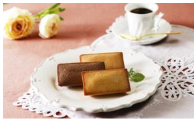
フィナンシェ 8個入り/ La Maison du Chocolat 価格：3,024円（東京都）

☆名前の通りまさに「宝石箱」のよう で、箱を開けた瞬間、お相手にも 笑顔になっていただけるお品。