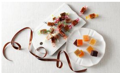
ラフィネの宝石箱/ ル・ボヌールパリス 価格：5,562円（兵庫県）

☆名前の通りまさに「宝石箱」のよう で、箱を開けた瞬間、お相手にも 笑顔になっていただけるお品。