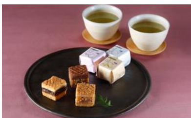
六瓢息災（むびようそくさい） 3種セット・30個入り/ 廣尾瓢月堂 中目黒店

☆会食場所とお土産をセットで手配できるのが便利で、魅力的。だしも茶の葉ようかんも優しいお味で、万人に好かれる。