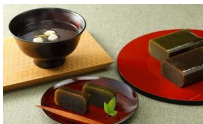
★赤坂とだ厳選「奥八女ギフト」/ 赤坂 とだ

☆月と鳥の再現性がすばらしく、カットするたびにアートの世界が広がるので、切るのが楽しい。