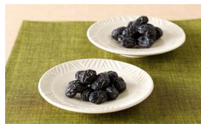
しぼり豆丹波黒大寿 小袋20袋入り籠/ 宝泉堂

☆甘い味だけではなく、野菜やだしのかりんとうなどバリエーションに富んでいるため男女問わず喜ばれる。