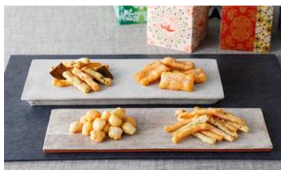
★大和しもしオリブなあられ 8個セット/ 奈良祥樂