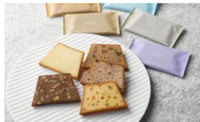
★ メープルプランタニエ/ オッジ 目黒本店 価格：2,592円（東京都）

☆フィナンシェは定番ですが、有名 なショコラ専門店が手がけ、特別 感・高級感がプラスされている。