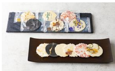
★有磯せんべい（6種） 48袋入/ 昭和三年創業 せんべいの田中屋

☆縁起のいい商品名と、一つひとつのサイズ感がちょうどよい。オフィス向けの手土産からお祝いのギフトまで、幅広い用途で利用できる。