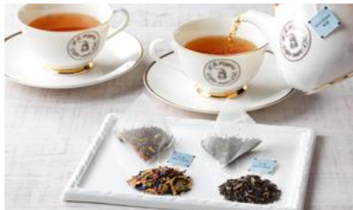
★ティーバッグ6個セット 「ベストセラーズセレクション」 【英国王室御用達 H.R.ヒギンス】/ H.R.ヒギンス 価格：5,400円（東京都）

☆有名ホテルに提供しているという実績もあり、信頼できるお品。水出し可能なので季節問わず、自信を持ってお贈りできる。