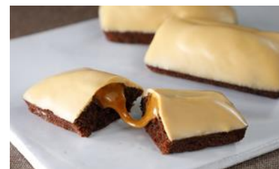
★ フィナンシェブロンドキャラメル 10個入/ パティスリー&カフェ デリーム 東京ミッドタウン日比谷店 価格：2,900円（東京都）

☆見た目の華やかさ、高級感、上品 なお味など、手土産の重要な要素、 全てにおいてパーフェクト。