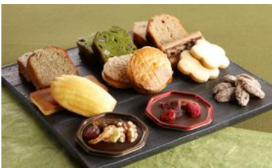
焼き菓子ギフト 彩 iro-dori/ PATISSERIE 築香1928 価格：3,300円（東京都）

☆枝豆を使われている珍しさ、G20に使用 されていた話題性もあり。話のネタに 困らず利用しやすい。