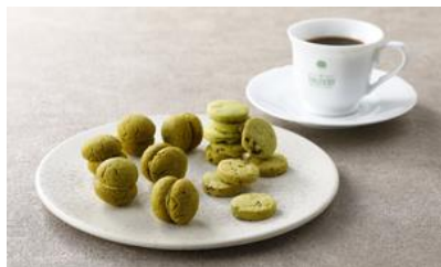
★ セット・ディ・ビスコッティ20/ Bicerin GINZA SIX 価格：4,320円（東京都）

☆グラデーションでとても美しく、 異なる5つの味を楽しめるためどなた に差し上げても喜ばれる。