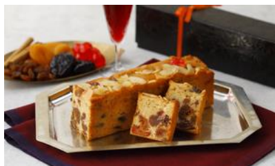
★ ごろっとふる一つけーき/ Patisserie Clair de lune 価格：3,240円（東京都）

☆名が表す通り、フルーツの存在感 が際立っている。パッケージも高級 感があり素敵。