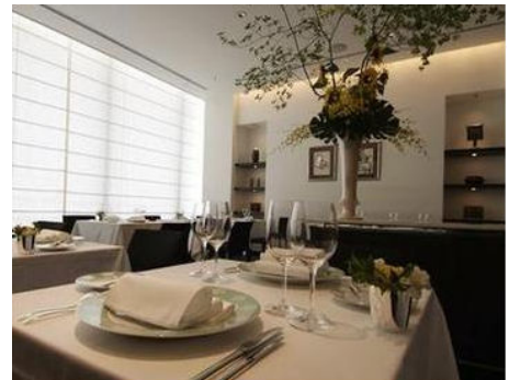
「レストラン タテル ヨシノ 汐留」の店内写真