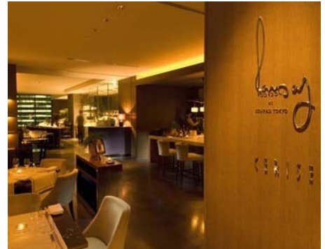
「セリーズ by ゴードン・ラムゼイ」の店内写真